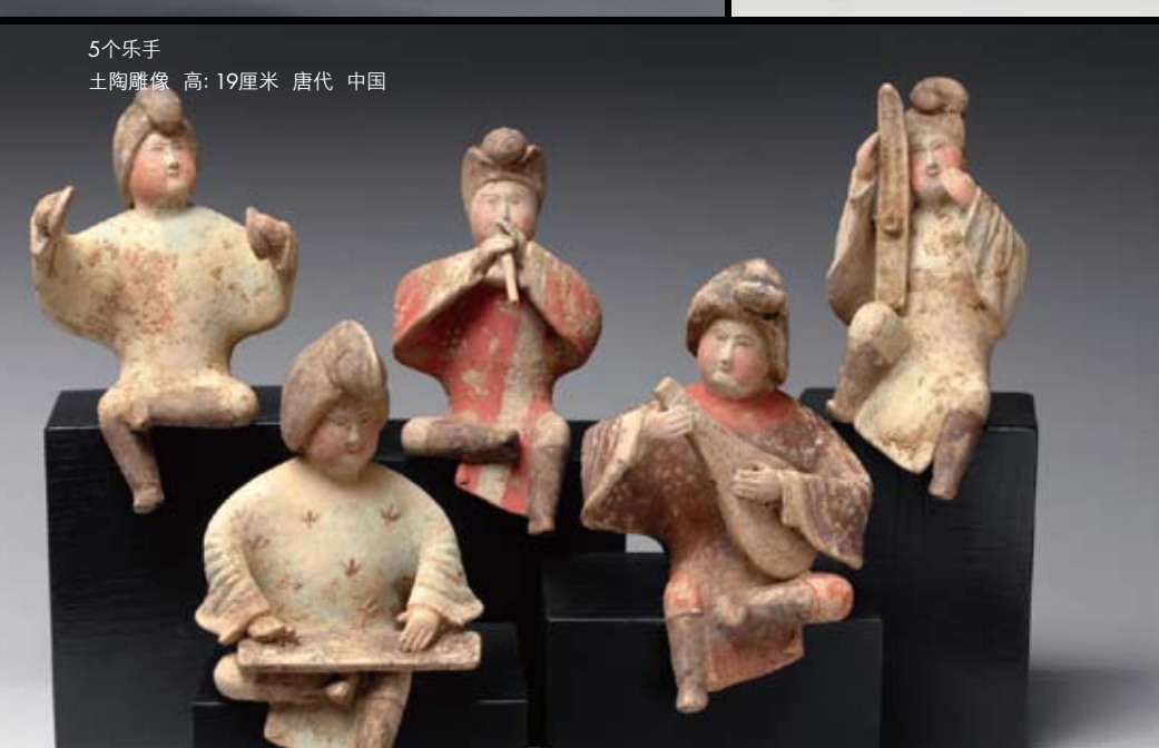
5个乐手 土陶雕像 高: 19厘米 唐代 中国