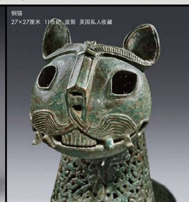
铜猫 27×27厘米 11世纪 波斯 美国私人收藏