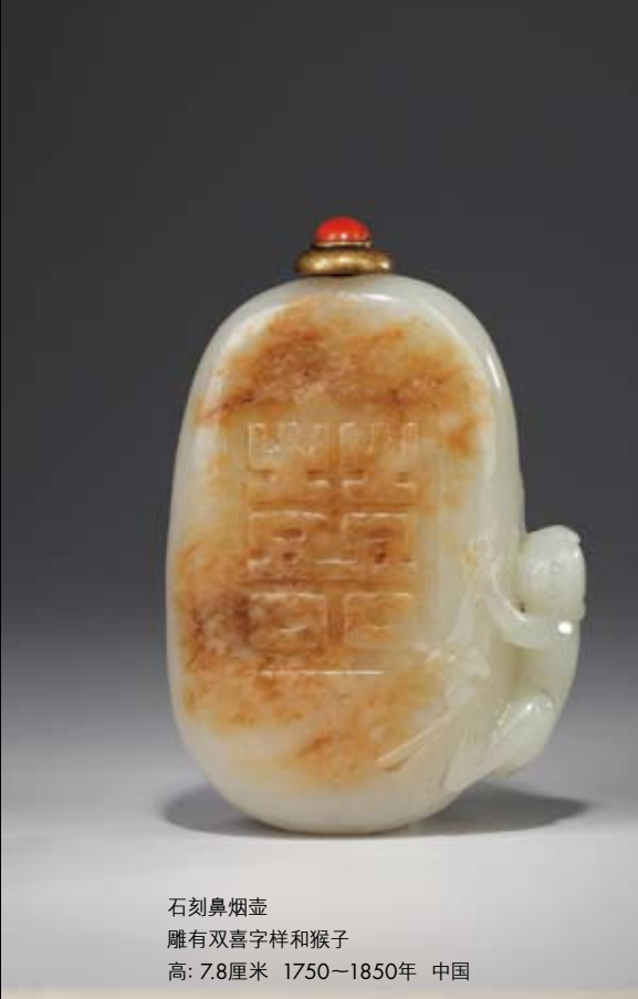
石刻鼻烟壶 雕有双喜字祥和猴子 高: 7.8厘米 1750—1850年 中国