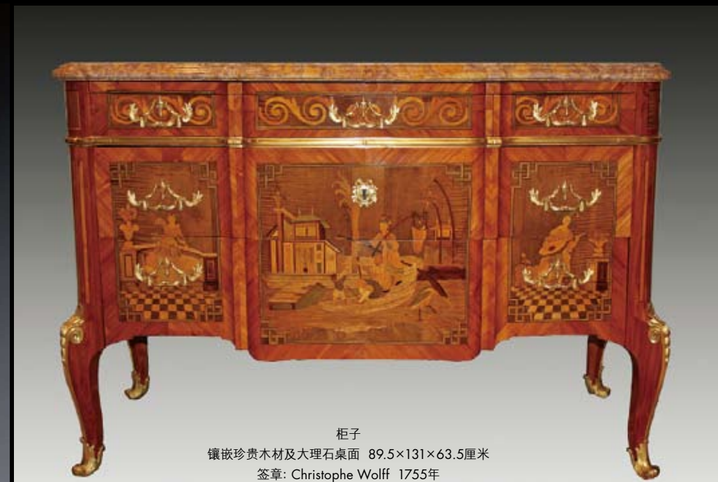
柜子 镶嵌珍贵木材及大理石桌面 89.5×131×63.5厘米 签章: Christophe Wolff 1755年