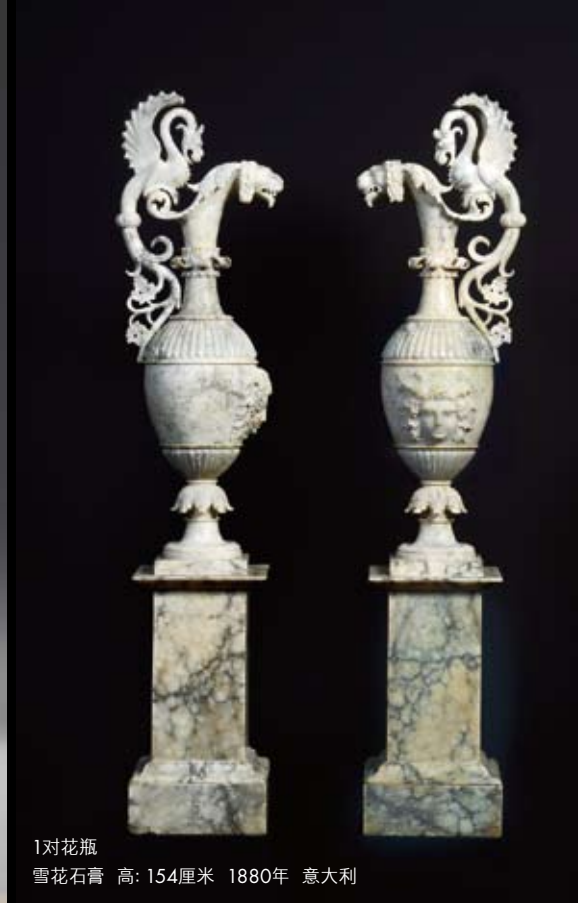
1对花瓶 雪花石膏 高: 154厘米 1880年 意大利