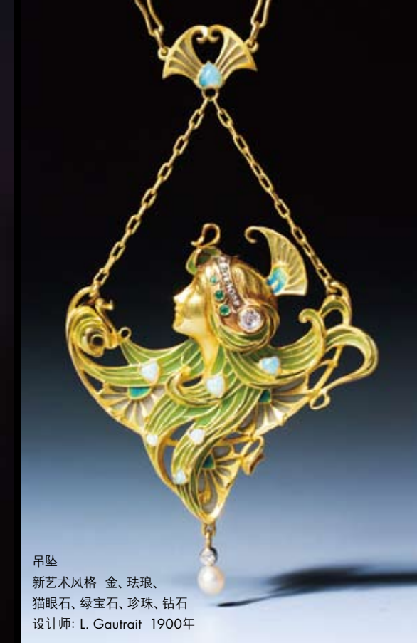
吊坠 新艺术风格 金、珐琅、 猫眼石、绿宝石、珍珠、钻石 设计师: L. Gautrait 1900年