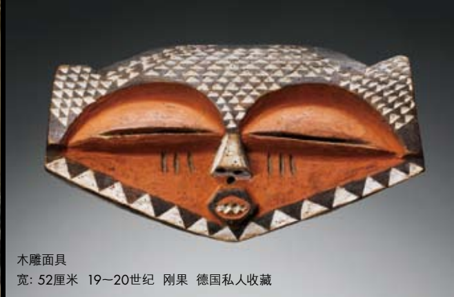
木雕面具 宽: 52厘米 19—20世纪 刚果 德国私人收藏