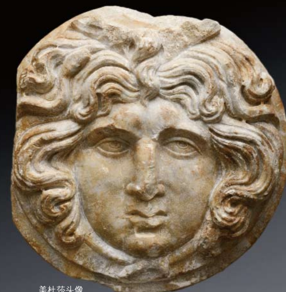
美杜莎头像 大理石 直径: 44.5厘米 2世纪 古罗马 比利时私人收藏

布鲁塞尔艺术博览会特邀荣誉展商——中非皇家博物馆展出其非凡收藏,包括极为罕见的、从未展示过的著名非洲面具、雕塑、珠宝和图腾,用馆藏级的艺术品展示出非洲艺术对现代艺术的深远影响。具有一定年代的大师作品必定会吸引众多热衷者的关注,中非皇家博物馆的亮相也将会给远古艺术品专家带来许多惊喜,布鲁塞尔艺术博览会无疑会成为欧洲艺术市场充满生机的音符。布鲁塞尔艺术博览会在博览会期间为藏家们提供了与顶级展商面对面交流的平台。为了保证艺术品的质量,主办方一直坚持由100个独立专家来筛选展品,力求通过展会向新老藏家提供更具价值的艺术品。布鲁塞尔艺术博览会展览期间,在每天下午两点半为参观者提供免费论坛,享誉国际的著名专家将会在这里为来自全球各地的艺术爱好者们做出话题性演讲。布鲁塞尔艺术博览会,一个真正的国际交流平台,让热爱艺术的人们在艺术圣殿里无限徜徉,尽情享受。T