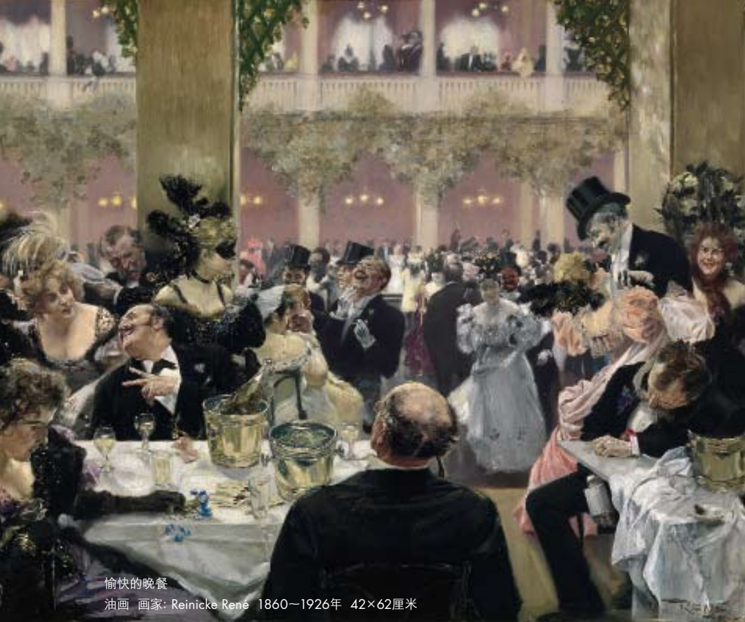
愉快的晚餐 油画 画家: Reinicke René 1860—1926年 42×62厘米